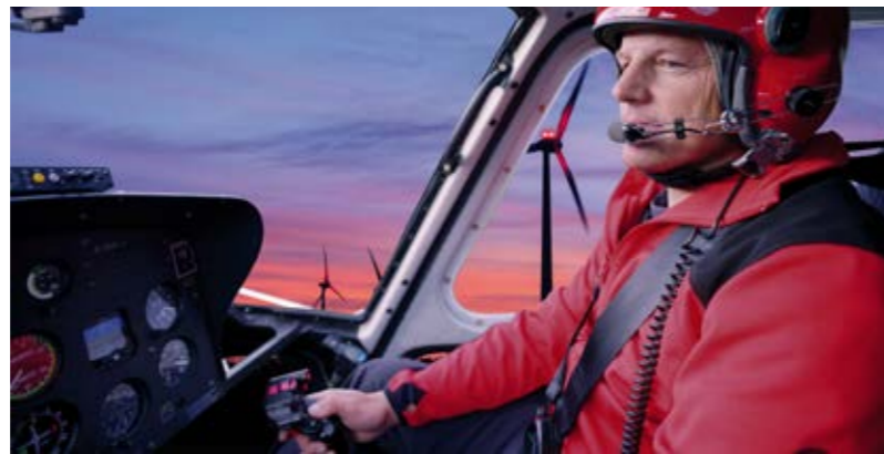
▲ BNK: pro Flugsicherheit und bürgerseitiger Akzeptanz

BNK-Systeme steuern den Ein- und Abschaltvorgang der Flughindernisbefehrerung an Windenergieanlagen: Nur bei Annäherung von Luftfahrzeugen in