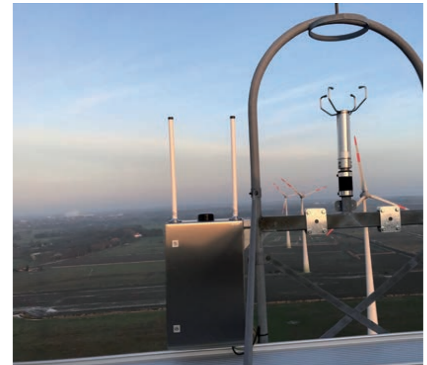
▲ Light:Guard Receiver: Montage auf der Gondel

Die LCU-T ist eine im Windpark installierte Steuerungseinheit für die windparkinterne Flughindernisbefehrerung. Dabei wird die Befehrerung über eine individuell mit den Befehrerungsherstellern entwickelte Schnittstelle angesteuert. Die Steuerung der Flughindernisbefehrerung kann auf bis zu